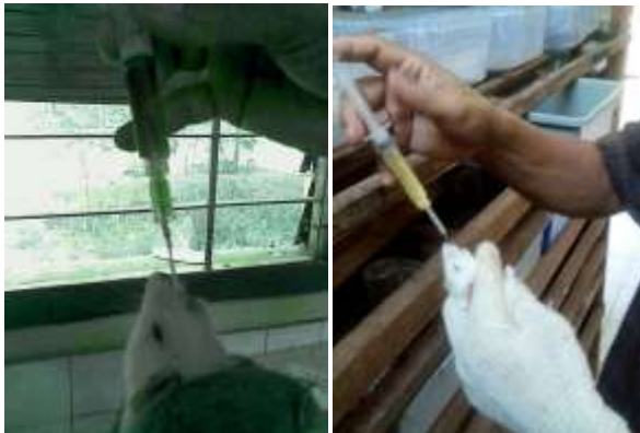
Gambar 4. Pemberian Jus Daun Ubi Jalar dan Kuning Telur Bebek