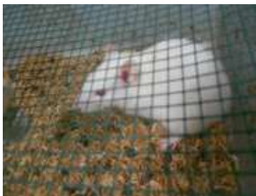
Gambar 5. Kandang Tikus