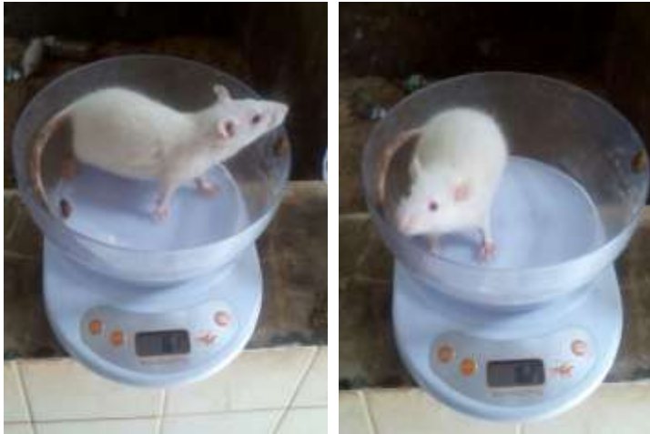
Gambar 3. Penimbangan berat badan tikus