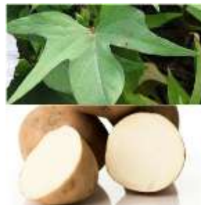
Gambar 6. Daun Ubi Jalar Putih