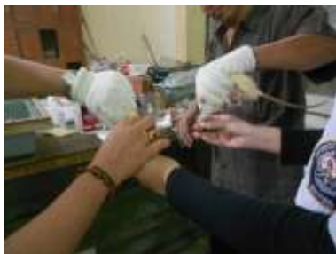
Gambar 7. Proses pengambilan darah tikus