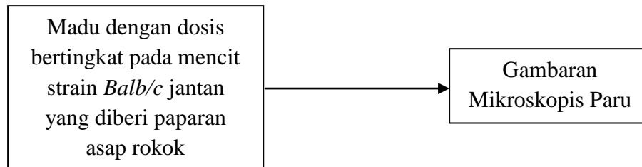
Gambar 5. Kerangka Konsep