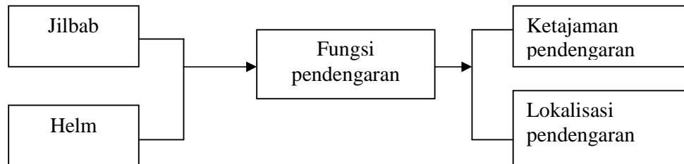
Gambar 7. Kerangka konsep