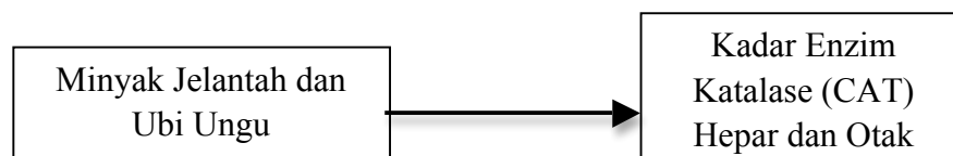
Gambar 5. Diagram Kerangka konsep