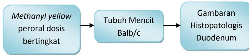
Gambar 5. Kerangka konsep