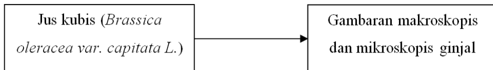
Gambar 3. Kerangka konsep