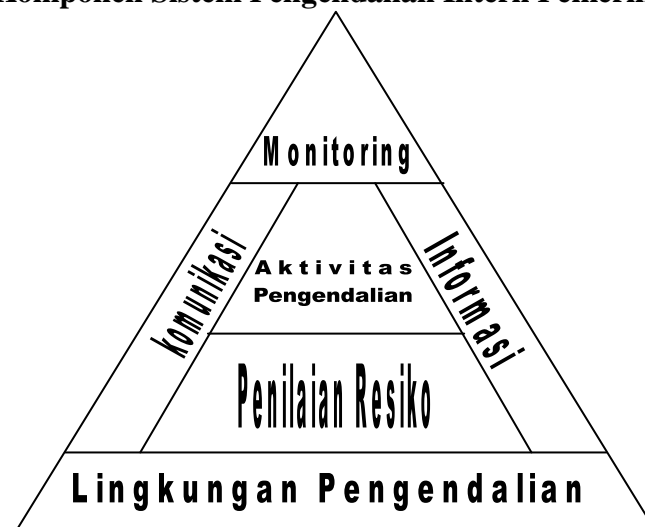
Gambar 2.1 Komponen Sistem Pengendalian Intern Pemerintah

Sumber : The COSO Model, The Internal Auditing Handbook