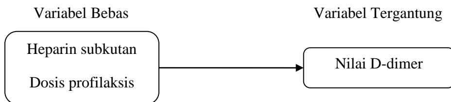
Gambar 4. Bagan kerangka konsep