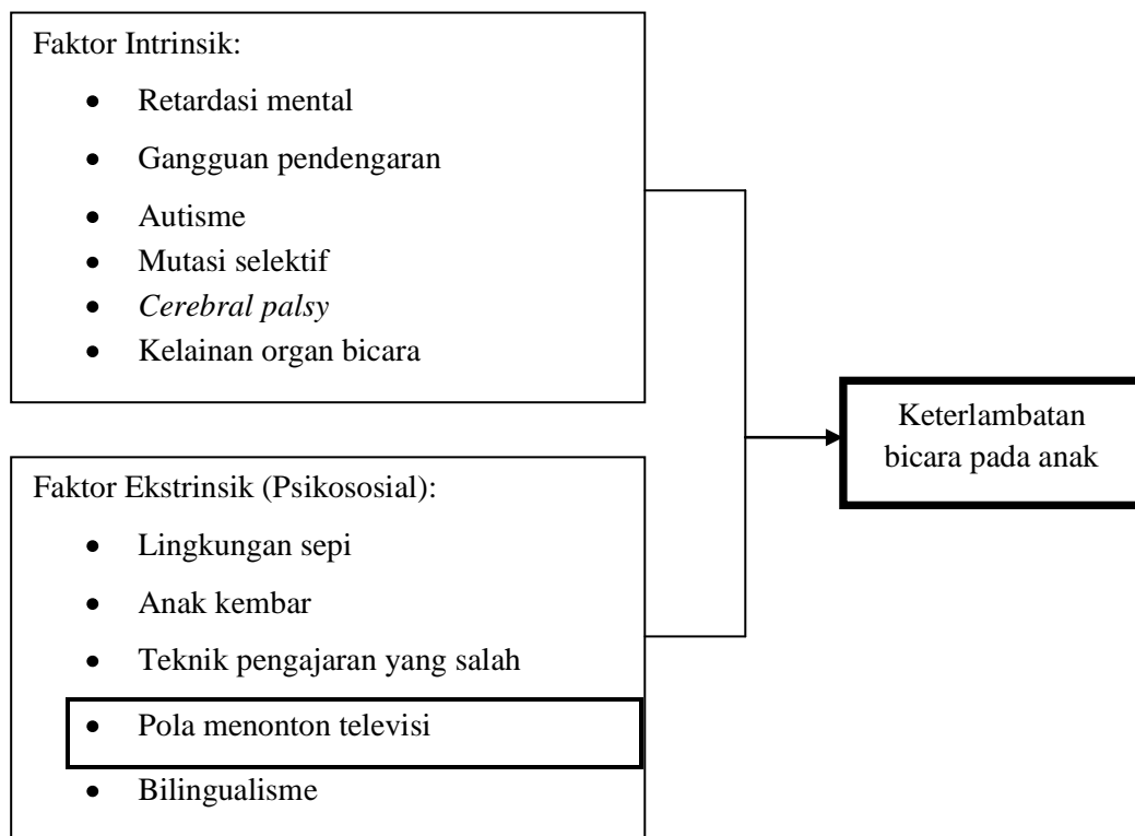
Gambar 1. Kerangka teori

Berdasarkan tinjauan pustaka di atas, maka dapat digambarkan kerangka teori sebagai berikut: