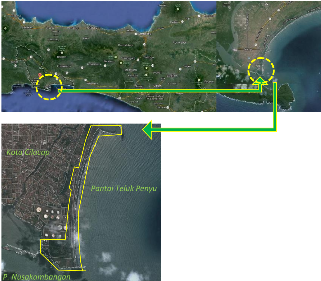
Gambar 19 Peta Lokasi Pantai Teluk Peny

Pantai Teluk Peny terletak di Kota Cilacap, kota yang terletak di selatan Jawa Tengah.