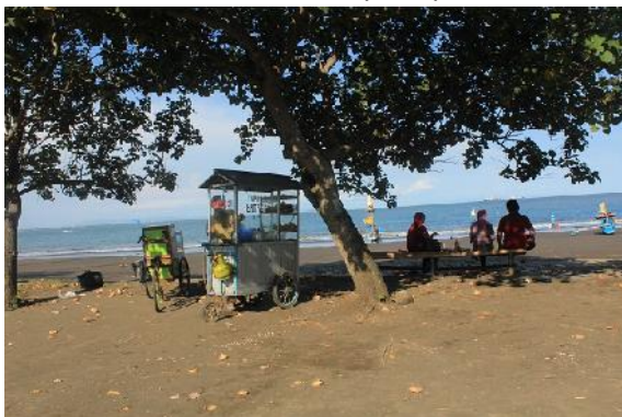
Gambar 21 Kondisi Sitting grup Pantai

Pantai Teluk Penyu telah beberapa kali mengalami renovasi dan penataan. Namun hingga saat ini penataan yang bisa dinikmati pengunjung hanya sebatas gazebo, sitting grup yang tidak sesuai dengan kondisi lingkungan pantai, dan penambahan sign nama Pantai Teluk Penyu di pintu masuk dan di areal pantai.