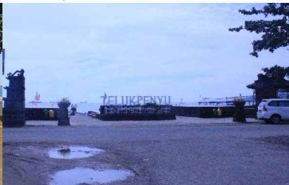
Gambar 22 Sign Teluk Penyu