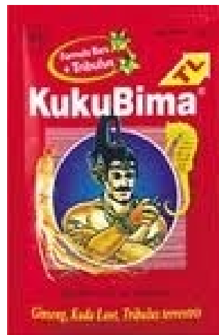
Gb 3 Produk Kuku Bima TL dalam bentuk Jamu

yakni rasa manggga, susu soda dan teh. Namun tidak semua varian rasa ini diterima pasar, karena yang dominan laku ternyata varian rasa anggur. Kelebihan lain produk Kuku Bima Ener-G adalah kandungan ginseng dan Royal Jelly plus vitamin B12.