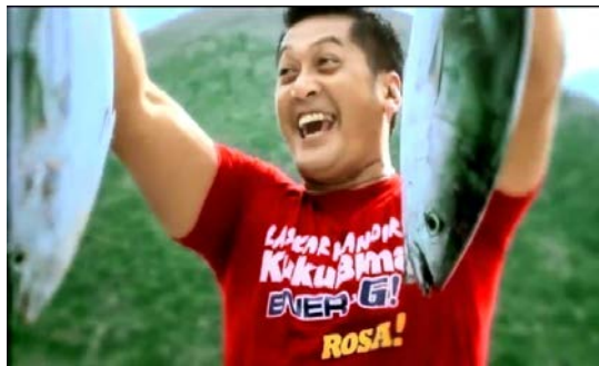
Gb 23. Teknik Kamera Close Up untuk menangkap Ekspresi kegembiraan Endorser

cukup keras yang perlu dilakukan untuk mendapatkan kedua ikan tuna ukuran besar seperti yang ada dalam genggamannya. Ini berarti siapapun wisatawan, jika memancing di perairan Maluku, maka akan dengan mudah menangkap ikan tuna.