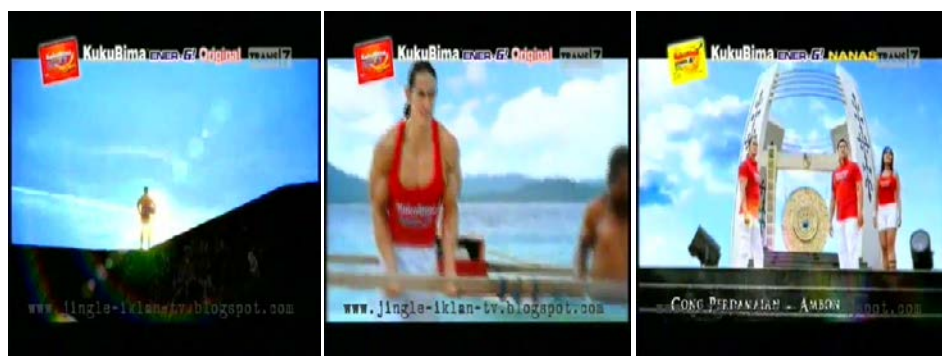
Gb 11. Pakaian Para Endorser TVC KBE Versi Maluku

Namun demikian, mode pakaian masing-masing endorser terdapat perbedaan. Bambang Pamungkas mengenakan pakaian celana pendek putih dan baju kaos sepak bola bernomer punggung 20. Nomer 20 adalah nomer yang sudah melekat pada Bambang Pamungkas sebagai pemain nasional sepak bola Indonesia. Pakaian Bambang Pamungkas menegaskan posisinya sebagai salah seorang pemain sepakbola terbaik yang dimiliki Indonesia. Denada mengenakan pakaian tank top merah dan celana putih pendek. Tubuh Denada yang energik dan seksi menjadi lebih menonjol. Endorser wanita lainnya Rieke Diah Pitaloka mengenakan atasan kaos merah dan celana putih panjang. Endorser pria Dony Kusuma mengenakan pakaian atasan kaos merah dan celana putih panjang. Baik Rieke Diah Pitaloka maupun Dony Kusuma meski memiliki latar belakang berbeda, namun keduanya ditampilkan sebagai sosok yang hadir sebagai wisatawan yang dapat membaaur dengan masyarakat lokal tanpa adanya jarak yang berarti. Sementara Ade Rai mengenakan kaos singlet merah sehingga memperlihatkan ototnya yang perkasa.