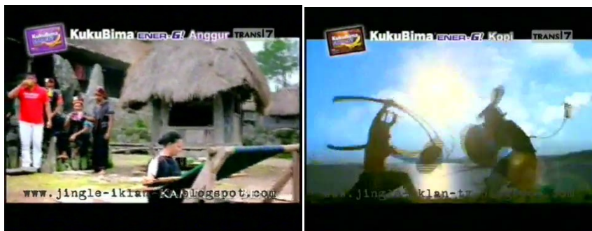
Gb 25. Kekhusyukan masyarakat lokal menenun dan menari Caci

tarian Caci . Para lelaki di Flores adalah lelaki pemberani yang memiliki sifat heroik. Tarian Caci yang gerakan intinya adalah saling menyerang dan bertahan satu dengan lainnya adalah tarian yang menunjukkan sifat heroik tersebut. Ekspresinya jelas, ketidaktakutan atau keberanian menghadapi tantangan. Caci dimiliki oleh seluruh kampung di Manggarai, Flores Barat. Tari ini selalu dilakukan oleh laki-laki berasal dari pihak ata one (tuan rumah) dan ata pe'ang (pendatang) yang kerap disebut juga meka landang (tamu penantang). Jumlah penari beragam. Namun, peraturan “perang” sama; mereka harus berperang satu lawan satu. Yang satu bertugas sebagai pemukul ( paki ), sedangkan yang lain menjadi penangkis ( ta'ang ). ( http://warisanindonesia.com/2012/04/caci-perang-tanpa-dendam/ diunduh Senin, 9 Juli 2012 pk1 13.00 Wib).