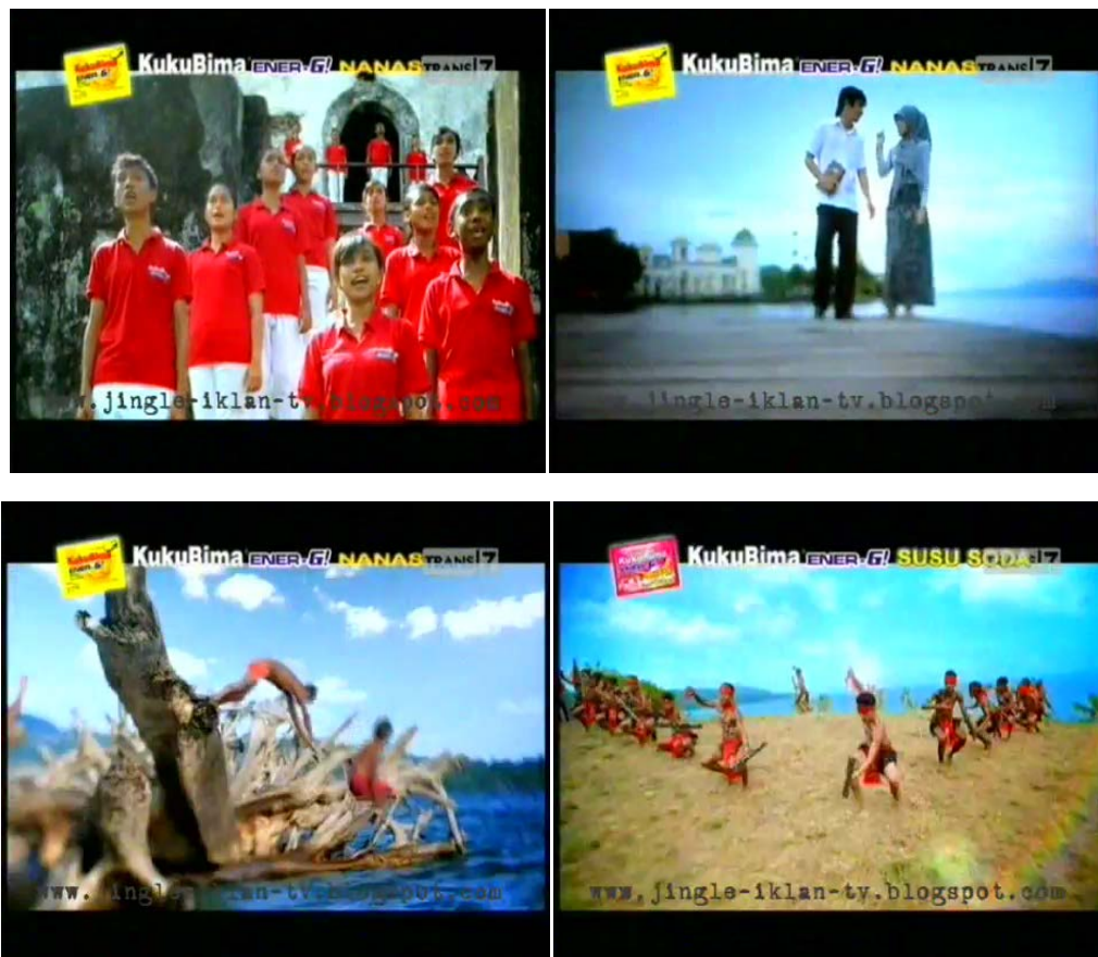
GB 12. Pakaian Para Penduduk Lokal

Hampir dalam semua scene , pakaian warna merah dan putih mendominasi. Jika hal ini dikontekskan dengan upaya menciptakan kesan Maluku sebagai wilayah yang telah damai dan hamonis, maka ada kesesuaian mengingat warna merah dan putih adalah warna dari lambang bendera Indonesia sebagai negara yang menaungi wilayah Maluku. Atas nama kepentingan bangsa dan negara Indonesia, maka perbedaan diantara anak-anak bangsa haruslah disingkirkan.