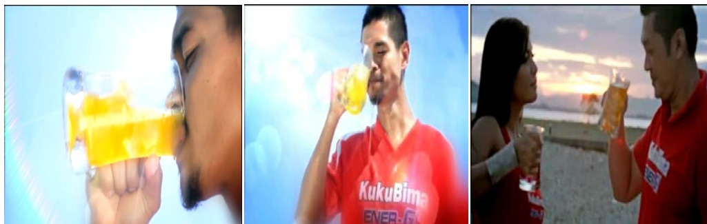
Gb 22. Teknik Kamera Close up untuk Menangkap Ekspresi Kepuasan Endorser Menikmati Produk KBE

Gambar close up yang terdapat didalam iklan KBE versi Maluku lainnya adalah untuk menampilkan ekspresi para endorser ketika minum Kuku Bima Ener-G. Wajah Bambang Pamungkas saat minum dan setelah minum di tampilkan secara close up dengan fokus pada dua tanda yakni wajah Bambang Pamungkas dan gelas besar yang berisi minuman KBE. Denada dan Dony Kusuma juga diperlihatkan melakukan aktivitas minum KBE dari gelas besar dengan latar belakang suasana pantai yang sedang berganti dari sore menuju malam.