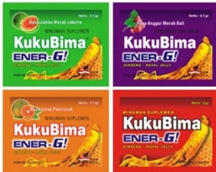
Gb 4. Varian Rasa Kuku Bima Ener-G