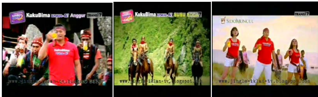
Gb 27. Beberapa scene dengan Teknik Kamera Medium Shoot

Para pemuda di bukit Irene yang mahir menunggang kuda tanpa pelana juga dishoot melalui medium shoot . Gambar yang dihasilkan menunjukkan dimana aksi menunggang kuda dilakukan, siapa yang menunggang kuda dan bagaimana pakaian yang mereka kenakan. Medium shoot menempatkan pelaku iklan pada lokasi-lokasi dimana aktivitas mereka dilakukan. Medium shoot menempatkan endorser dan apa yang dilakukannya dalam konteksnya. Misalnya aktivitas menenun para wanita di Kampung Bena. Dengan teknik medium shoot , jadi jelas bahwa ibu-ibu penenun itu adalah ibu-ibu dari kampung Bena bukan dari Batak Toba di Sumatera Utara karena ada latar belakangnya yakni perkampungan Bena di Bajawa.