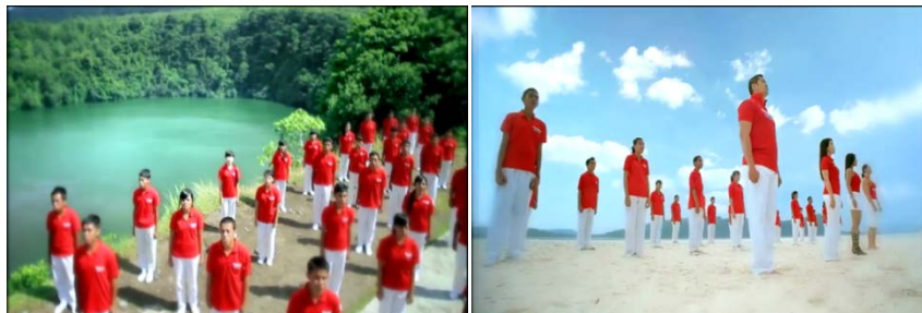
Gb 17. Teknik kamera longshoot menangkap ekspresi tertib, tunduk dan kekompakkan

Teknik pengambilan medium shoot lainnya juga ditunjukkan melalui gambar-gambar dimana pemuda-pemudi berbaju merah dan bercelana panjang putih sedang menyanyi didalam Benteng Amsterdam, di tepi Danau Kelimutu dan di pantai berpasir putih. Gambar-gambar tersebut memperlihatkan bagaimana ekspresi para pemuda-pemudi dibarisan terdepan ketika bernyanyi dan rapinya barisan para pemuda-pemudi di belakangnya. Kombinasi medium shoot dilakukan dengan menggerakkan kamera ke kanan, ke kiri, zoom in dan zoom out , sehingga memperlihatkan seluruh barisan pemuda dan pemudi yang didepannya para endorser seperti Denada, Rieke Diah Pitaloka, Dony Kusuma dan Ade Rai ikut menyanyi.