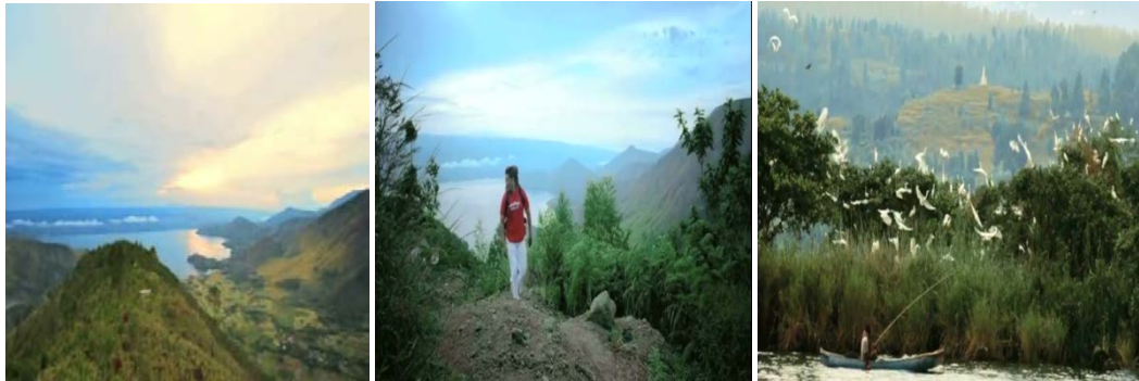
Gb 8. Teknik Kamera Longshoot TVC KBE versi Sumatera Utara

Keindahan Danau Toba dirangkaikan dengan beragam aktivitas budaya masyarakat yang mendiami Pulau Samosir. Dimulai dengan gambar seni kriya berupa pahatan tradisional di atas kayu bermotif tradisional dalam teknik kamera close up . Hal ini nampaknya untuk mempertegas bentuk-bentuk seni pahatan dan sekaligus memperlihatkan keaslian dari pahatan tersebut. Ada motif khas dari seni pahatan termasuk pewarnaannya yang berbeda dengan seni pahat di daerah lainnya. Kehidupan masyarakat di Pulau Samosir yang ditunjukkan dalam iklan adalah aktivitas menenun kain Ulos yang dilakukan oleh para ibu dari penduduk lokal. Gambar diambil dengan teknik kamera medium shoot sehingga memperlihatkan aktivitas menenun dengan latar belakang rumah adat khas suku Batak. Penggunaan medium shoot ini dengan memperlihatkan latar belakang rumah adat suku Batak adalah untuk mempertegas bahwa aktivitas menenun yang dilakukan dalam iklan KBE versi Sumatera Utara ini lokasinya di di Pulau Samosir Sumatera Utara, bukan di daerah lainnya yang juga dikenal memiliki keterampilan budaya menenun.