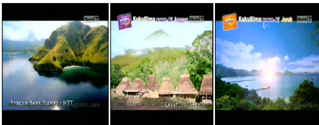
Gb 26. Teknik Kamera Longshoot untuk menangkap keindahan alam

Scene pembuka iklan adalah gambar longshoot dari udara yang memperlihatkan gugusan pulau di Laboan Bajo. Kamera bergerak pelan menangkap keindahan pulau dengan pegunungan yang dikelilingi lautan. Gugusan pulau yang tidak terlalu luas memungkinkan gugusan pulau bisa ditangkap kamera dalam longshott yang tidak terlalu ekstrem. Penggunaan kamera longshoot digunakan hampir pada seluruh gambar awal yang menunjukkan pergantian obyek wisata. Seperti dari keindahan laut ke keindahan danau Kelimutu.