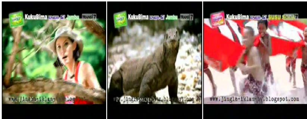
Gb 28. Beberapa Scene menggunakan Teknik Kamera Close up

menjanjikan hal lain selain kenikmatan. Demikian juga dengan berbagai potensi wisata yang dalam pemikiran awam sulit dinikmati dari jarak dekat melalui shoot close up, menjadi seolah-olah mudah didekati.