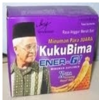
Gb 5 Mbah Maridjan dalam bungkus Kuku Bima Ener-G

Keempat bauran pemasaran ( marketing mix ) yakni masing-masing; produk, harga, distribusi dan promosi, memiliki peran yang mendukung kesuksesan pemasaran sebuah produk. Namun dari sejumlah bauran, promosi memiliki peran yang cukup besar apalagi produk yang diluncurkan bukan produk baru melainkan