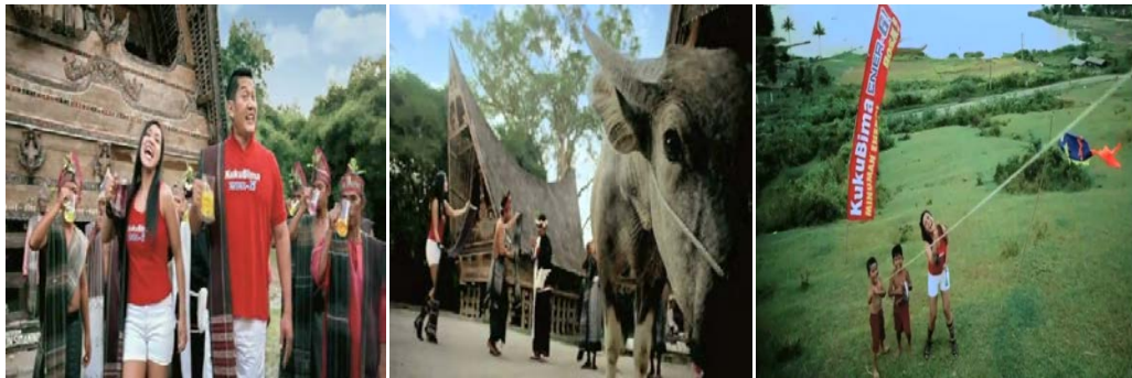
Gb 6. Pakaian para Endorser dan Penduduk Lokal

Terdapat perbedaan dari penampilan para endorser dibandingkan dengan para aktor dari penduduk lokal. Warna pakaian endorser lebih dominan berwarna merah dan putih. Warna-warna ini secara denotatif di asosiasikan dengan dua hal yakni, pertama warna dominan dari KBE, yaitu warna merah. Hal ini diperkuat dengan adanya tulisan Kuku Bima Ener-G pada bagian depan setiap baju yang dikenakan para endorser . Kedua, warna celana putih dan baju merah, mengasosiasikan pada lambang bendera Indonesia yakni merah putih. Penggunaan warna merah putih menjadi wujud dari representasi dari negeri bernama Indonesia.