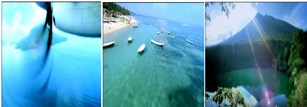
Gb 13. Teknik Kamer Long Shoot TVC KBE Versi Maluku

menggunakan teknik kamera bergerak di udara dalam posisi longshoot menjadikan gambar dalam iklan pun menjadi gambar-gambar yang sangat eksotik dan tentu saja akan mengundang orang untuk melihatnya secara langsung dengan menjadi seorang wisatawan.