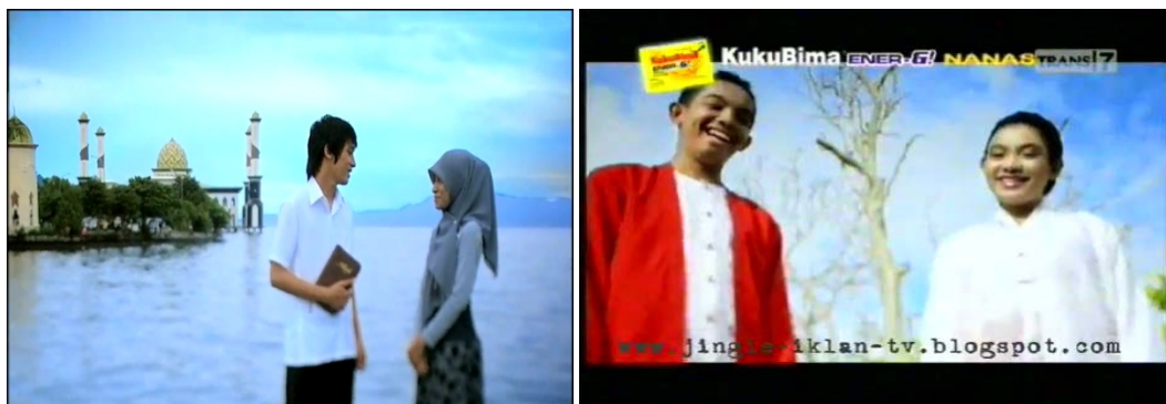
Gb 18. Teknik Kamera Medium Shoot menangkap hubungan erat antar pemeluk agama dan suku yang berbeda

menjadi hal yang dalam imaji masyarakat kebanyakan sangat sulit dijumpai. Maluku adalah tanah yang kental dengan nuansa perseteruan agama Kristen dan Islam. Teknik kamera medium shoot menampilkan keakraban yang penuh makna dari dua identitas yang selama ini selalu berdiri pada posisi diametral. Gambar yang hampir sama juga ditampilkan pada dua orang remaja putra putri yang berdiri berdampingan, sambil memperlihatkan senyum keceriaan mereka.