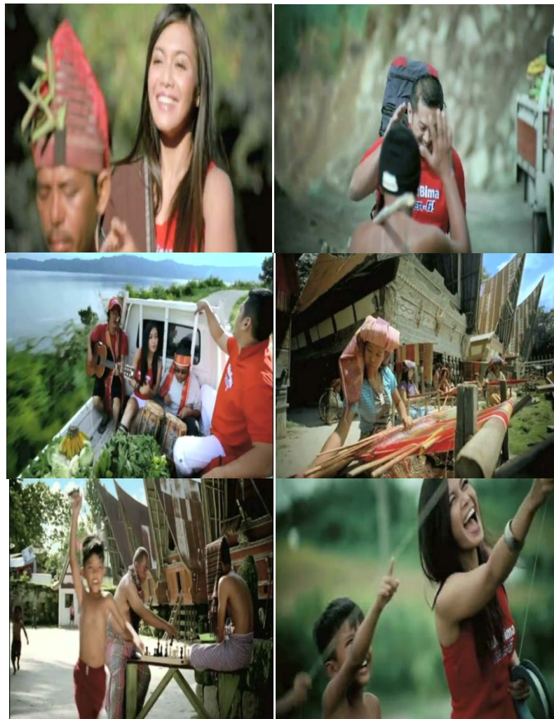
Gb 7. Berbagai Ekspresi Endorser dan Penduduk Lokal

Realitas lainnya yang ditampilkan dari TVC KBE versi Sumatera Utara adalah ekspresi kekaguman, kesenangan, kegembiraan dan kebahagiaan terutama dari para Endorser. Hampir dalam setiap scene yang memunculkan ekspresi endorser