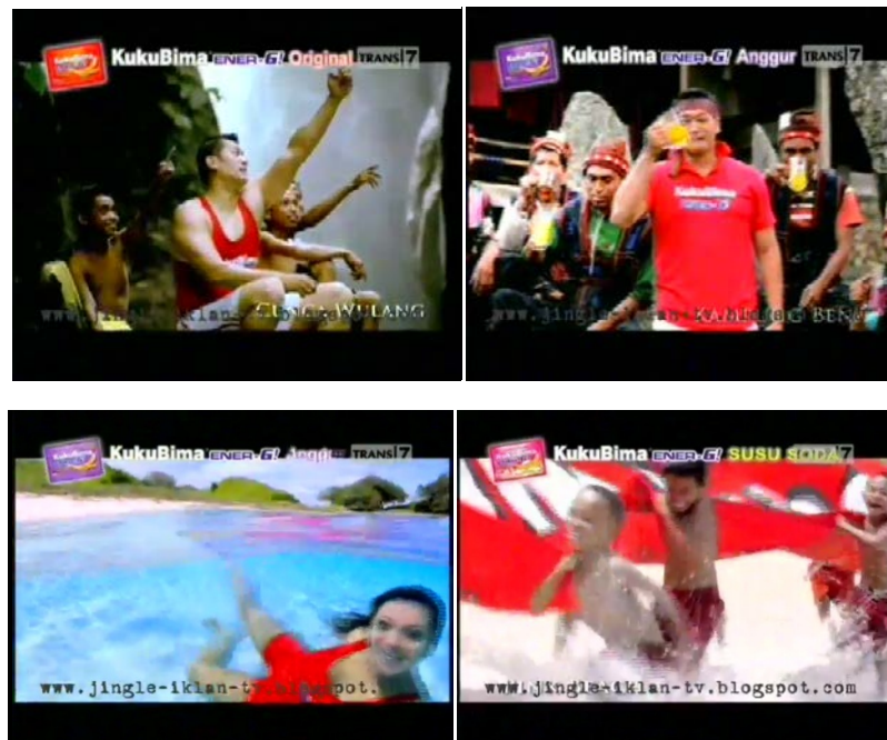
Gb 24. Beberapa Ekspresi Endorser dan Penduduk Lokal