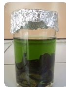
Gambar 1. Proses Ekstraksi

heksan. Alat yang digunakan adalah beaker glass , gelas ukur, erlenmeyer, corong pemisah, dan spektrofotometer. Rangkaian alat ekstraksi dapat dilihat pada Gambar.