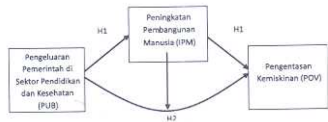
Gambar 1. Skema Kerangka Pemikiran Teoritis

Berdasarkan uraian tersebut di atas maka alur pikir penelitian tentang peran pembangunan manusia (dalam hal ini di-proxi dengan indeks pembangunan manusia) dalam kaitannya dengan hubungan antara pengeluaran pemerintah sektor publik terhadap pengurangan kemiskinan, baik IPM sebagai variabel moderating maupun sebagai variabel intervening adalah sebagai berikut: