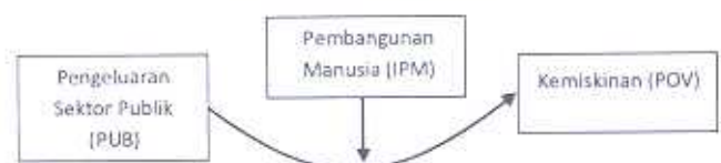
Gambar 2. Analisis Regresi Berganda dengan Variabel Moderating