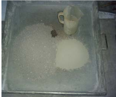
Pembuatan adukan mortar