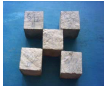
Sampel benda uji kuat tekan mortar