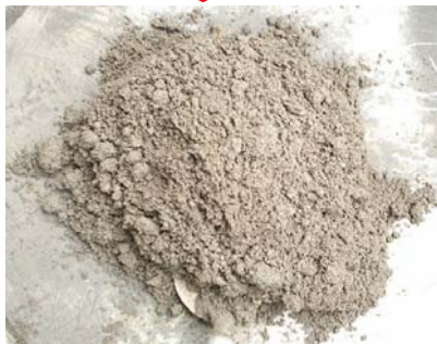
Adukan mortar siap dicetak