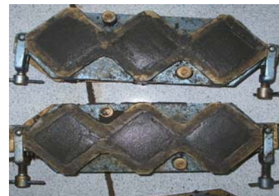
Mortar dibiarkan 24 jam