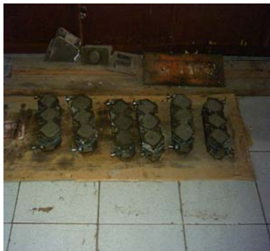
Adukan dimasukkan specimens mold