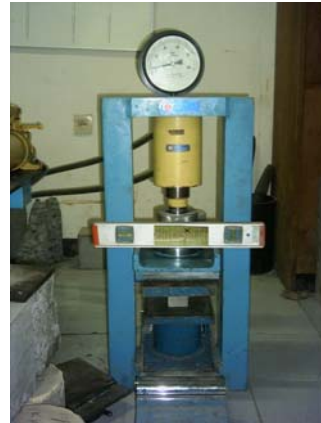
Pengujian dengan Compression Test