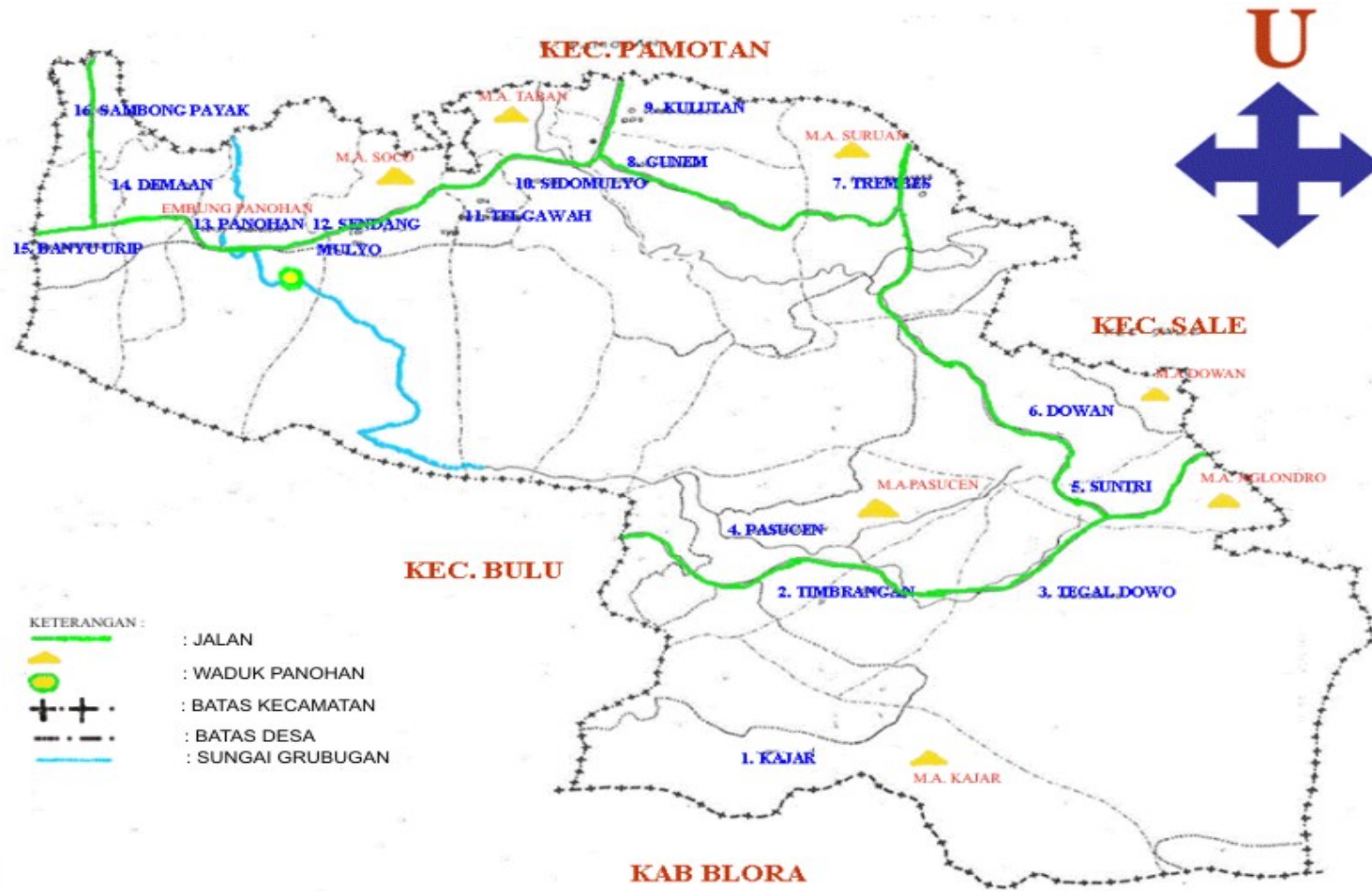
Gambar 4.2 Peta Lokasi Waduk Panohan Dan Sumber Mata Air Di Daerah Kecamatan Gunem.