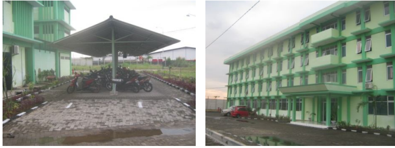
Gambar 3.12. Parkir Asrama Mahasiswa UNISSULA Semarang