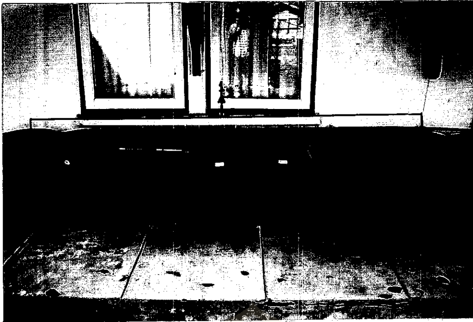
Gambar 2. Lokasi Penelitian