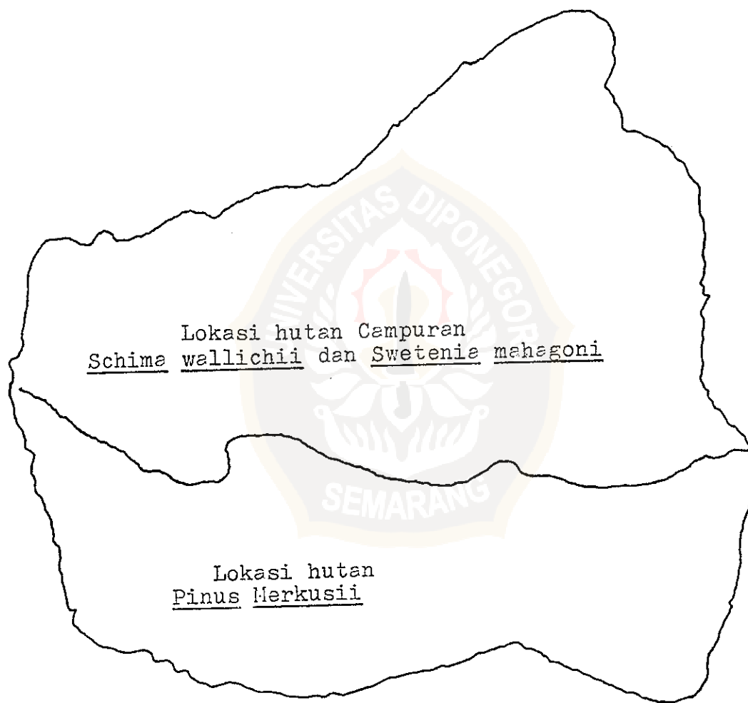
Gambar 7 Peta lokasi penelitian