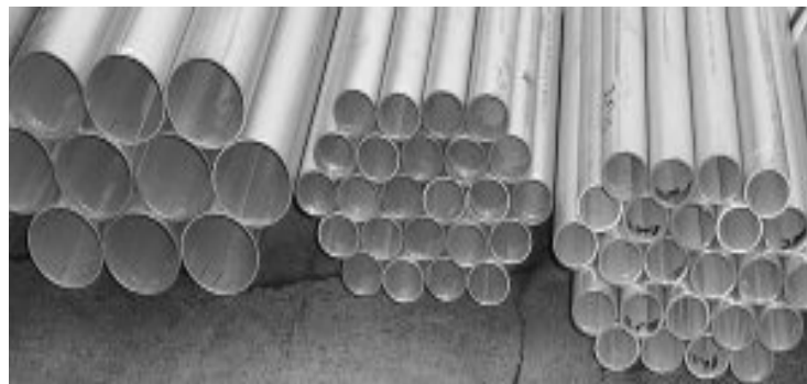
Gambar 6.6. Pipa Galvanis

Pipa jenis ini digunakan untuk suplai air laut (sistem Ballast dan Bilga).