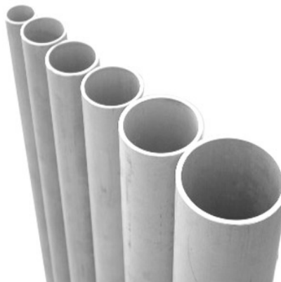
Gambar 6.1. Seamless Drawing Steel Pipe

Pipa ini boleh digunakan untuk semua penggunaan dan dibutuhkan untuk pipa tekan pada sistem bahan bakar dan untuk pipa pengeluaran bahan bakar dari pompa injeksi bahan bakar dari motor pembakaran dalam