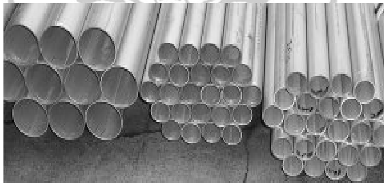
Gambar 6.6. Pipa Galvanis

Pipa jenis ini digunakan untuk suplai air laut (sistem Ballast dan Bilga).