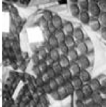
Gambar 6.3. Lap Welded Steel Pipe

Pipa ini seharusnya tidak dipergunakan dalam sistem dimana tekanan kerja melampaui 350 Psi atau temperature lebih besar dari pada 450 0 F dan juga tidak untuk tekanan dan temperatur manapun didalam sistem dimana pipa yang tidak bersambungan dibutuhkan