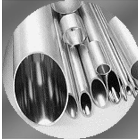
Gambar 6.2. Seamless Drawn Pipe