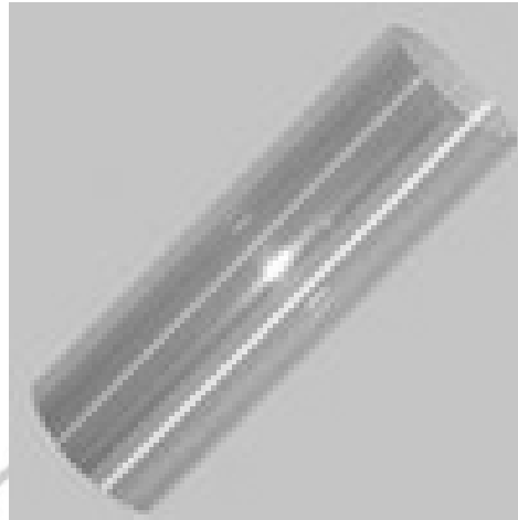
Gambar 6.5. Baja Schedule 40

sistem bilga, kecuali dalam ruangan yang kemungkinan mudah terkena api sehingga dapat melebar dan merusak sistem bilga.