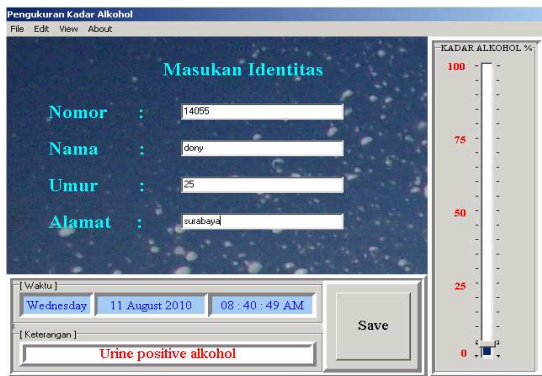
Gambar 4. Tampilan Pada Saat Pengujian Sampel Urine Pemabuk

Pada gambar 3 menunjukkan bahwa pada saat komputer mendapatkan masukan data dari mikrokontroler yaitu pada pengujian sampel urine non-alkohol, sistem menunjukkan bahwa sampel yang di uji menunjukkan keterangan ' urine negative alkohol ' yang artinya urine tidak terdapat kandungan alkohol.