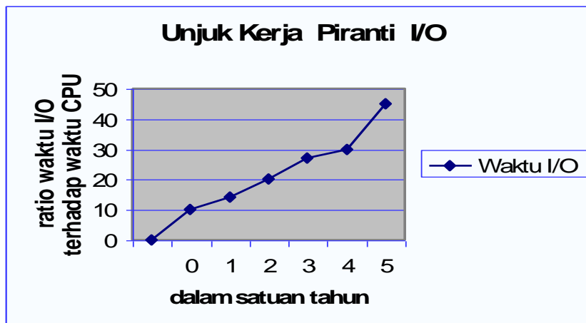
Gambar 3: Grafik unjuk kerja Piranti I/O .

Dari gambar 3 dapat ditunjukkan bahwa pada 0 tahun pertama ratio antara waktu I/O terhadap elapsed time 10%, pada 1 tahun kemudian ratio waktu I/O terhadap elapsed time adalah 14%, seterusnya makin naik, akhirnya pada tahun ke 5 ratio adalah 45%. Dari persentasi ratio waktu I/O dan waktu CPU yang semakin naik menunjukkan unjuk kerja piranti yang semakin baik.