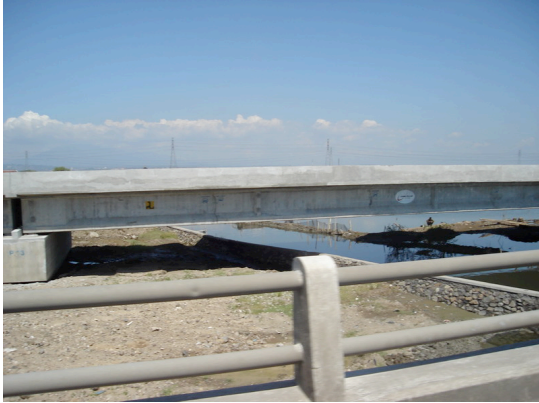
Gambar 1.3 Jembatan Kali Tenggang

Pada ruas jalan arteri utara ini terdapat tiga buah kali yang memotong jalan eksisting, yaitu Kali Banger, Kali Banjir Kanal Timur, serta Kali Tenggang. Untuk mengatasi hal ini, maka dibangunlah dua buah jembatan, yaitu Jembatan Kali Banjir Kanal-Banger (STA 0+790 hingga STA 1+050) dan Jembatan Kali Tenggang (STA 1+790 hingga STA 1+940).