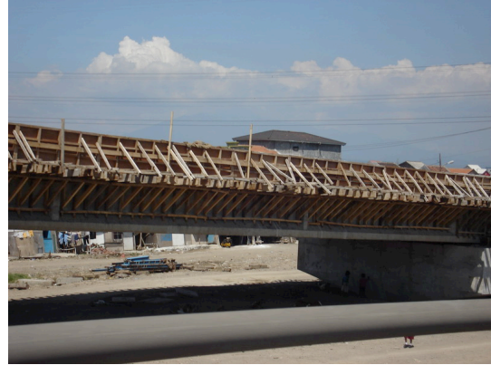
Gambar 1.2 Jembatan Kali Banjir Kanal – Banger

Dalam Tugas Akhir ini dilakukan perencanaan ulang perkerasan jalan lingkar utara Semarang dengan menggunakan rigid pavement ( pada STA 1+725 hingga STA 1+975 ), serta perancangan ulang jembatan kali Tenggang.