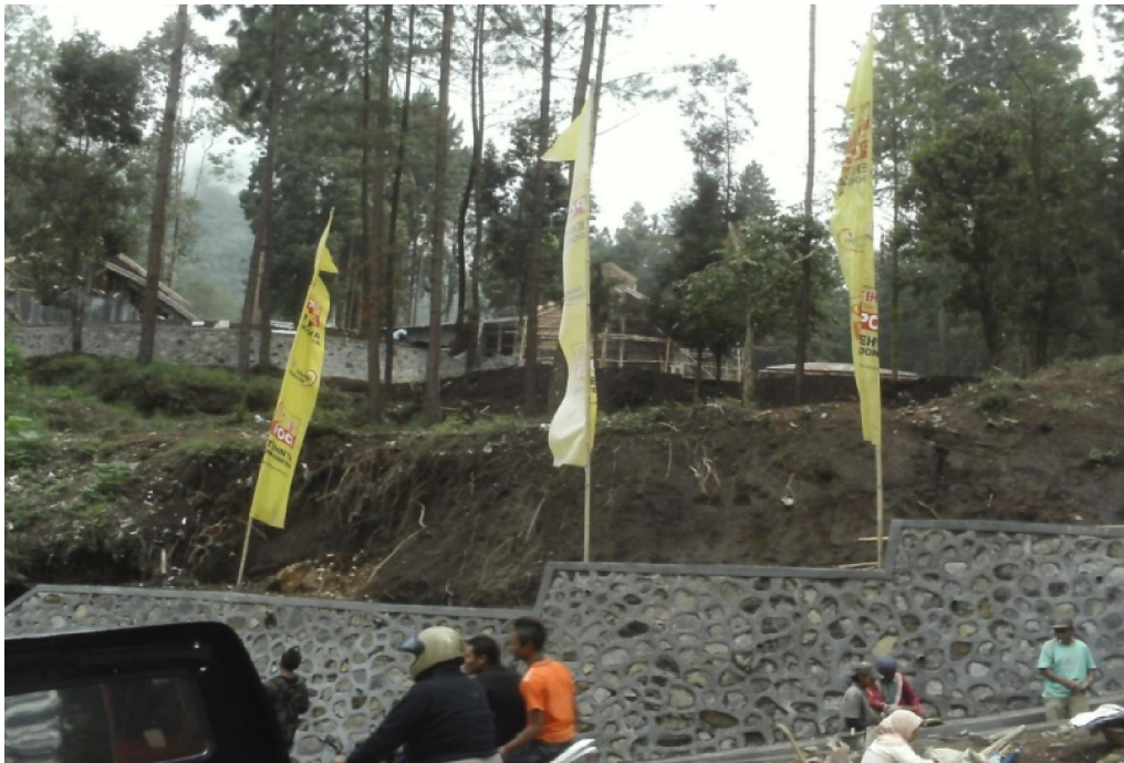
Sumber : Observasi Lapangan 2010

sebagai tempat wisata alam dan pendukung sistem penyangga kehidupan terancam oleh eksploitasi serta tekanan masyarakat dan pengunjung yang tidak memperhatikan perlindungan lingkungan. Data tahun 2008 menunjukkan bahwa di kawasan Taman Wisata Pemandian Air Panas Guci luas tutupan lahan yang ditumbuhi hutan tanaman keras hanya \pm 3,7 ha dari \pm 167,44 ha luas kawasan (Dinas Tanbunhut Kab. Tegal 2008). Hal ini disebabkan penebangan hutan yang dilakukan oleh pengelola dan masyarakat untuk alih fungsi lahan guna membangun infrastruktur seperti lapangan parkir, penginapan dan fasilitas penunjang wisata lainnya. Selain itu pengelola dan masyarakat juga melakukan pengeprasan bukit, hal ini mengakibatkan kemiringan lereng bukit ada yang mencapai 90^\circ dan gundul tanpa tanaman penyangga sehingga pada musim hujan, kawasan tersebut rawan terjadi bencana tanah longsor.