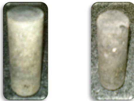
Gambar 1.1 Split dan Slag