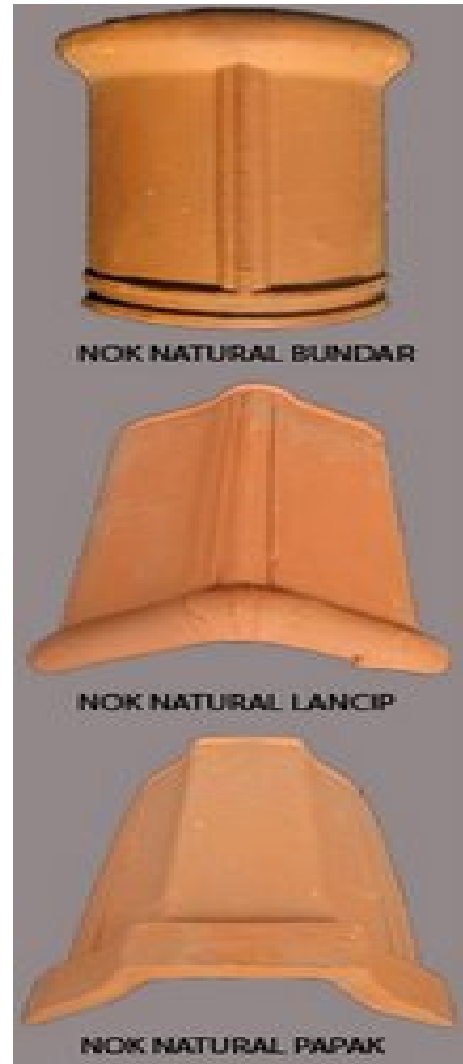
Gambar 4 Bentuk-bentuk kerpus Glazur