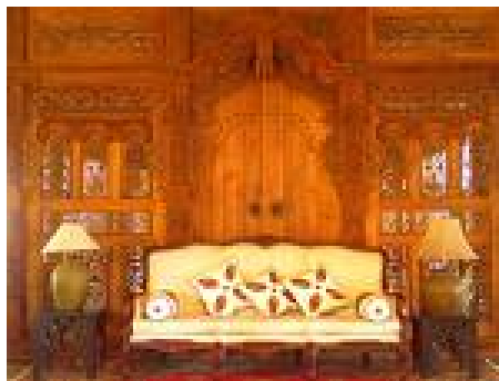
Gambar Gebyok Lemahan