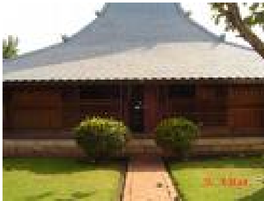
Gambar. 3. Rumah Adat Kudus tampak depan