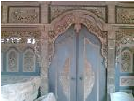
Gambar.4 Gambar Gebyok Kudus.