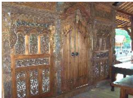
Gambar Gebyok Krawang

Gebyok Kudus merupakan bagian dari rumah adat Kudus yang saat ini paling diminati oleh masyarakat luas khususnya kalangan atas, para pejabat mulai dari yang di daerah hingga di Tingkat Pusat. Hal ini